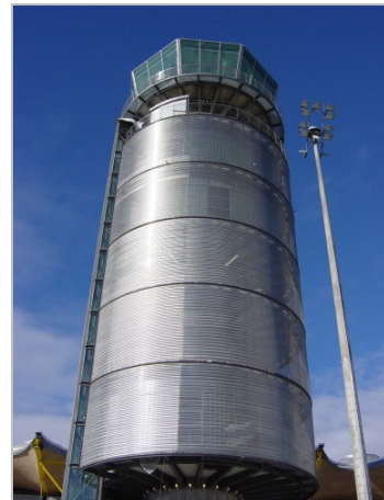
Bild 4: Der Flughafen Madrid-Barajas ummantelte zwei Kontrolltürme mit 1.600 Quadratmeter GKD-Edelstahlgewebe vom Typ ESCALE 7x1.