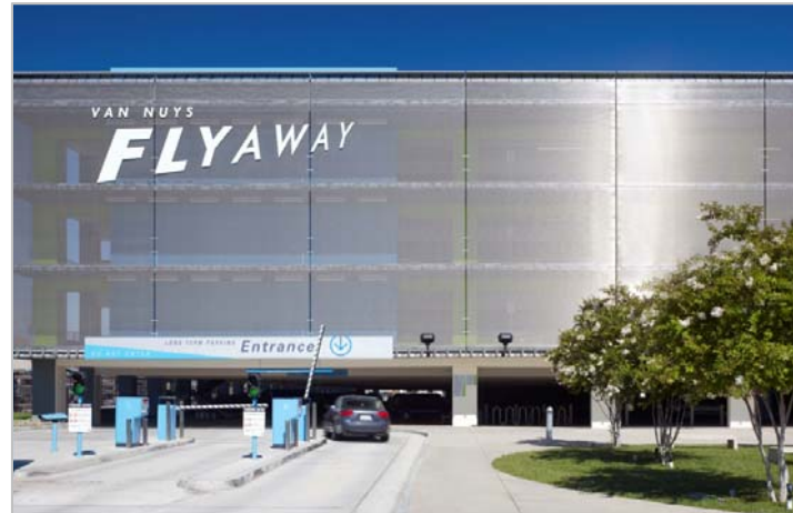
Bild 2: In Los Angeles umhüllen 1.500 Quadratmeter GKD-Gewebe vom Typ LAGO das Parkhaus am Van Nuys Airport.