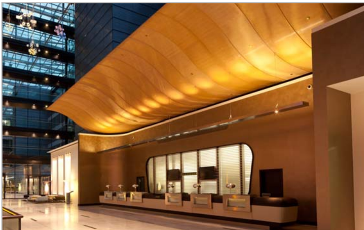
Bild 7: Die Architekten wählten das filigrane Bronzegewebe MANDARIN von GKD für die geschwungene Deckenkonstruktion der Rezeption des Hilton Frankfurt Airport Hotels.