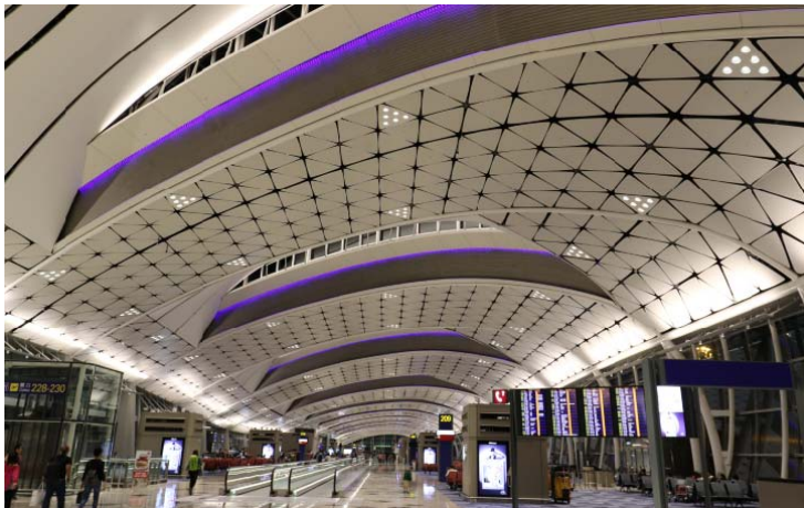
Bild 5: Im Hong Kong International Airport Midfield Concourse folgen 24 dreidimensional gebogene Elemente aus dem GKD-Gewebe ESCALE 5x1 dem Verlauf der Deckenbögen.