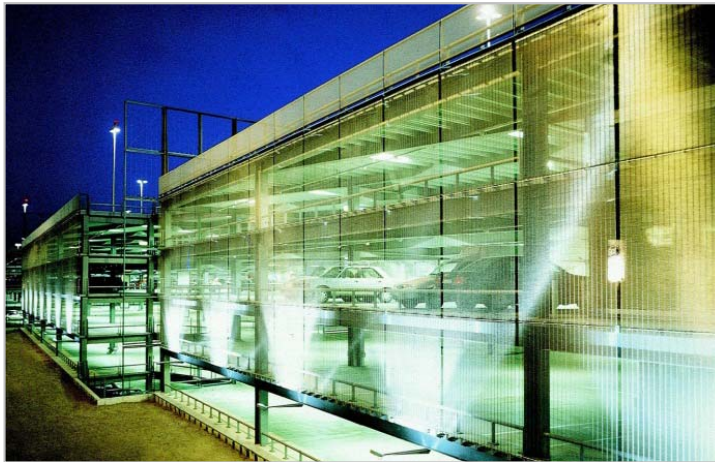
Bild 1: Für die Parkhausfassade am Terminal II des Flughafens Köln/Bonn wurde Mitte der 1990er-Jahre erstmals GKD-Metallgewebe zur Bekleidung verwendet.