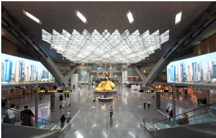
Bild 9: Im New Doha International Airport in Katar stellen vier MEDIAMESH®-Screens von GKD ihre Leistungsfähigkeit als aufmerksamkeitsstarke Werbeplattform unter Beweis.