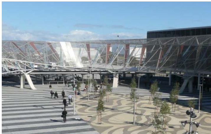
Bild 3: Am Adelaide Airport gestalten 2.000 Quadratmeter des GKD-Edelstahlgewebes vom Typ TIGRIS die vorgesetzte Schrägfassade des Verbindungswegs zwischen Terminal und Parkhaus.