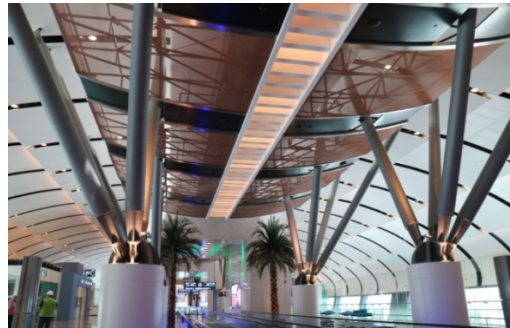
Bild 6: Im neuen Passagierterminal des Muscat International Airport formen bogenförmig an einer Stahlkonstruktion befestigte Paneele semitransparente Baldachine.