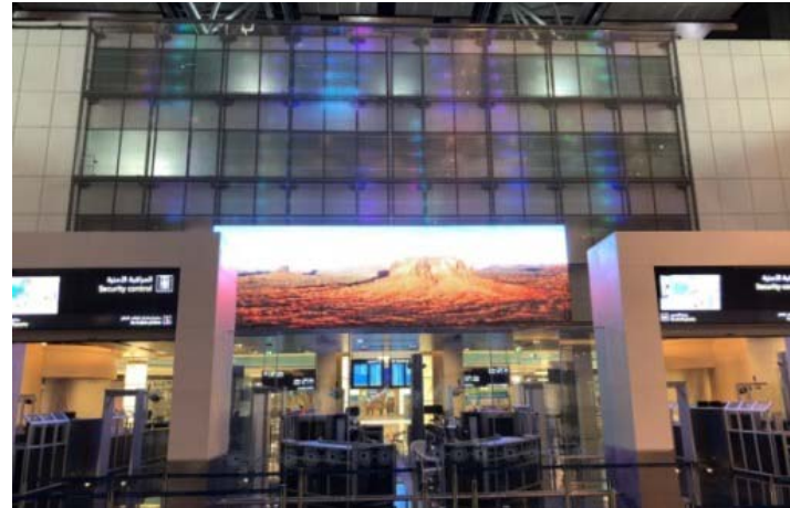
Bild 10: Ein Mixed-Media-Screen am Muscat International Airport kombiniert die transparenten GKD-Medienfassadensysteme MEDIAMESH® und ILLUMESH®.