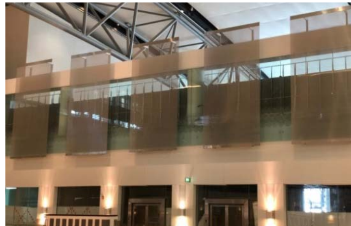
Bild 8: 7,5 Meter hohe Wandbehänge aus dem GKD-Gewebetyp LAMELLE werfen die Retail-Area im Muscat International Airport optisch auf.