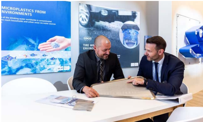
Bild 1: Die fachkundige Beratung der Gewebeexperten war auf der IFAT vielfach gefragt.