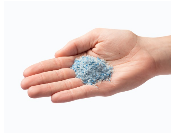
Bild 4: Das Brennpunktthema Mikroplastik zog viele Besucher an den GKD-Stand.