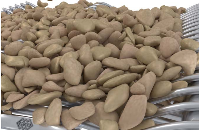
Bild 3: Das Porometric-Gewebe von GKD stand im Mittelpunkt der Industriegewebe.