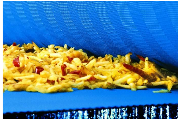
Bild 4: Nach FDA zertifizierte Polyesterbänder von GKD erfüllen auch die hohen Anforderungen der Fruchtsaftindustrie.