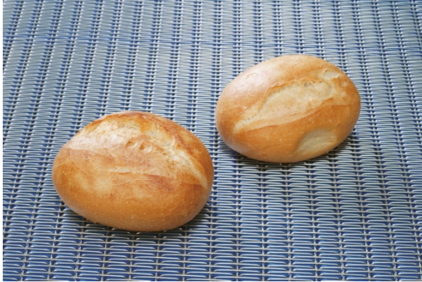
Bild 1: GKD-Bänder mit FDA-Zertifizierung sind für Transport und Verarbeitung unverpackter Lebensmittel weltweit zugelassene erste Wahl.