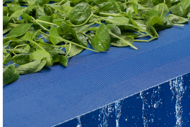
Bild 2: Ob zur Entwässerung, Trocknung oder Kühlung: Jedes der anwendungsspezifisch ausgelegten Prozessbänder von GKD ist komplett mit Naht FDA-zertifiziert.