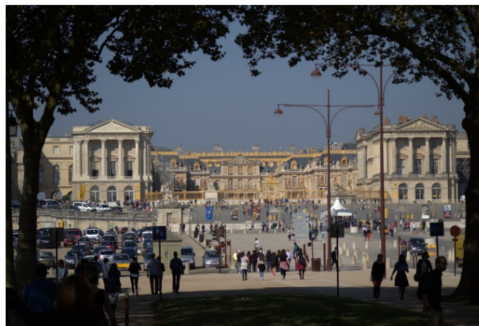
Bild 6: 2003 rief der französische Staat ein 500 Millionen Euro schweres Renovierungsprogramm ins Leben, um Schloss Versailles zu neuem Glanz zu verhelfen.