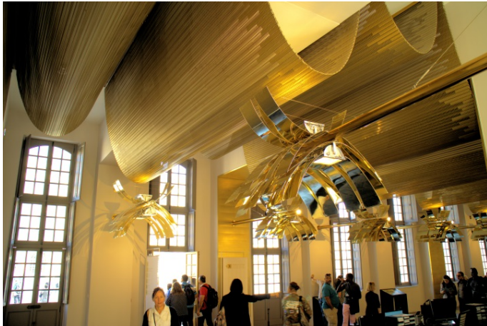
Bild 1: Perrault gestaltete eine goldene Decke, die sich wie ein gigantischer Baldachin in unregelmäßig großen Wellen entlang des gesamten Foyers schwingt.