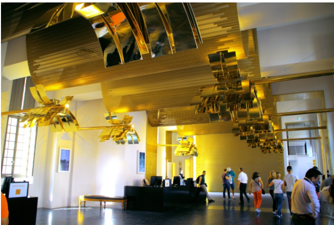
Bild 3: In die Flachdrähte eingeschobene Aluminiumstäbe in unterschiedlicher Länge verleihen dem geschmeidigen Gewebe eine noch nie zuvor gesehene, plastische Wirkung.