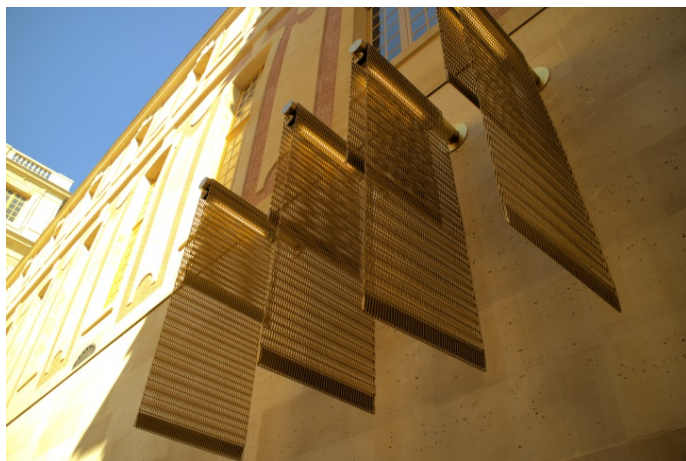
Bild 5: Wie Standarten über den Köpfen der Besucher drapierte Bahnen aus golden eloxiertem Metallgewebe von GKD.