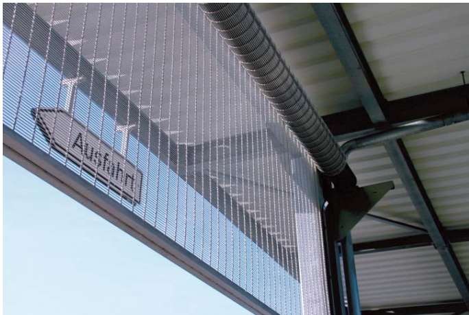
Bild 1: Absolutes Highlight am Stand von GKD waren Rolltore und Rollabschlüsse aus Metallgewebe.