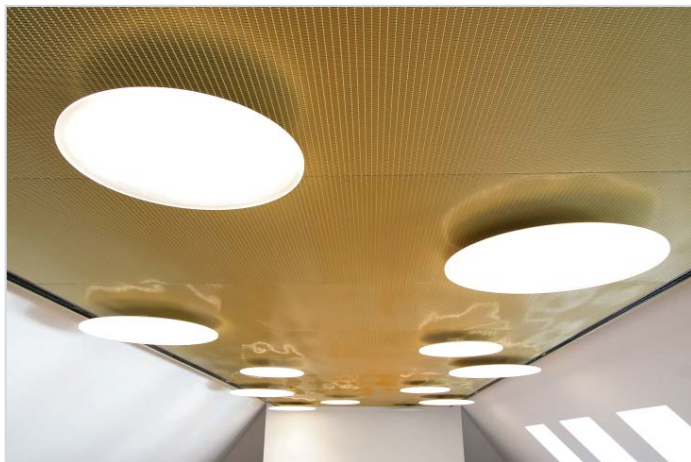
Bild 3+4: Ob zur Gestaltung exklusiver rasterfreier Decken ohne Durchhang, als formschöner Raumteiler oder Verkleidung von Säulen und Wänden: CMP-Gewebe von GKD optimieren nachhaltig jede Raumakustik.