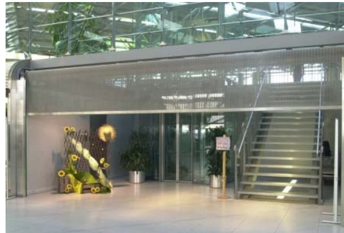
Bild 2: Trotz ihrer filigranen Anmutung bieten Rolltore und Rollabschlüsse von GKD zuverlässigen Schutz vor unerwünschtem Zutritt oder Diebstahl.