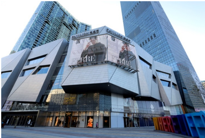
Bild 5: Das transparente Medienfassadensystem MEDIAMESH® von GKD unterstützt als Element der Corporate Architecture die visuelle Identität global agierender Unternehmen.