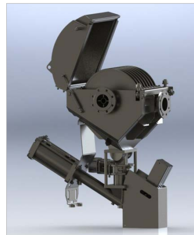
Bild 3: Geöffneter Maxflow-Filterkopf 504-80-DN100 mit vertikal angeordneten, statischen Filterscheiben aus Edelmischgewebe.