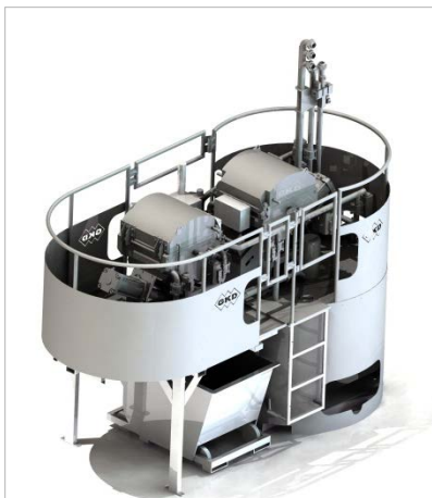
Bild 1: Auf der EMO in Hannover präsentiert GKD-Compact Filtration sein bewährtes Kompaktfiltersystem MAXFLOW.