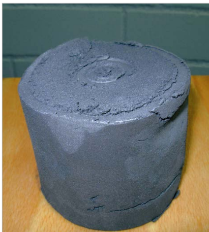
Bild 4: MAXFLOW ermöglicht einen sortenreinen Austrag der zurückgehaltenen Feststoffe als Brikett.

Gerne senden wir Ihnen die gewünschten Motive in druckfähiger Auflösung per E-Mail zu.