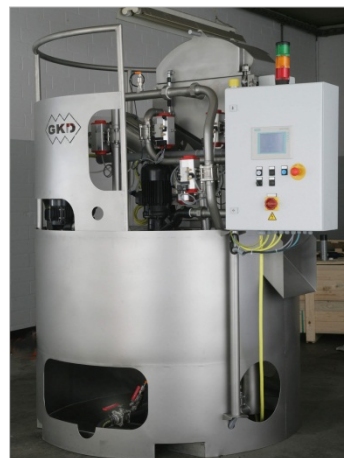
Bild 2: MAXFLOW vereint Filtration und Brikettierung in einer Anlage.