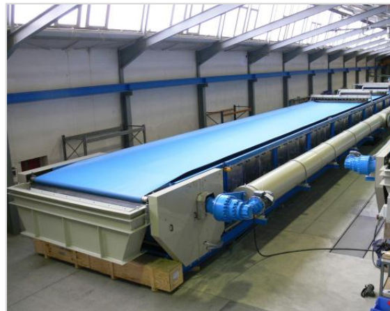
Bild 4: VACUBELT®-Filterbänder von GKD ermöglichen eine effiziente REA-Gips-Entwässerung auf Vakuumbandfilteranlagen.