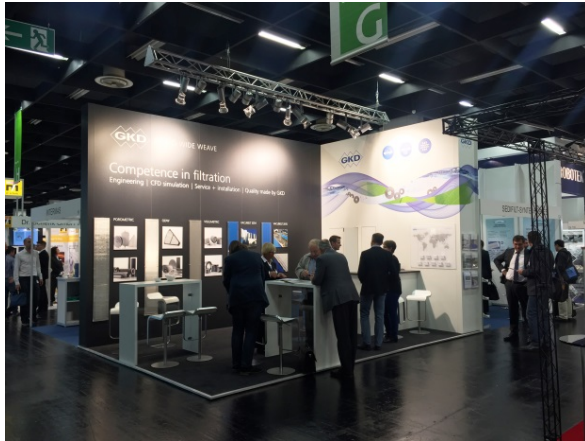
Bild 1: Die integrierte Kompetenz im Bereich Filtration stand im Mittelpunkt des Messeauftritts der GKD – GEBR. KUFFERATH AG.