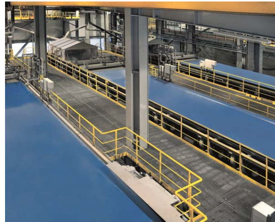
Bild 2: Mit VACUBELT®-Filterbändern für kontinuierlich laufende Vakuumbandfilteranlagen bietet GKD hochleistungsfähige Prozessbänder mit konstant hoher Entwässerungsleistung und robuster Querstabilität.