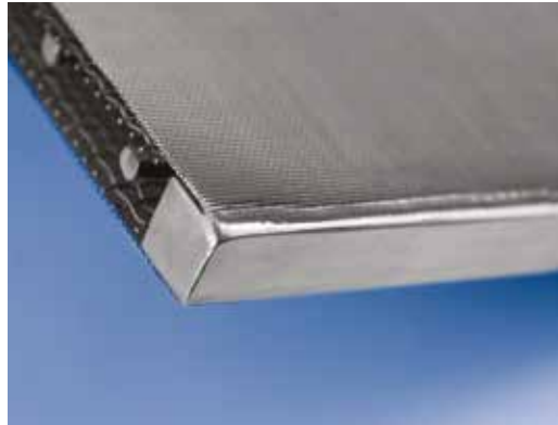
NeverLeak Gewebesweißnaht NeverLeak mesh welding