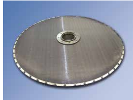
GKD Filterplatte geschraubt GKD filter leaf screwed