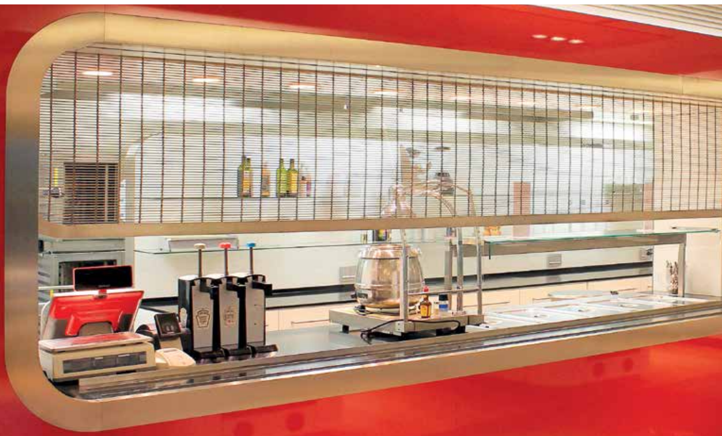
Rollabschluss in einer Kantine, Münster, Architekt: Vervoorts & Schindler Architekten BDA, Bochum, Gewebe: Tigris

Ausführung eignen sich die Systeme für den Außen- oder Innenbereich. Durch das transparente Erscheinungsbild lassen unsere GKD-Metallgewebe weiterhin den Blick auf die dahinter liegenden Bereiche zu und engen somit den räumlichen Gesamteindruck nicht ein. Ein darauf abgestimmtes Beleuchtungskonzept kann die transparente Ästhetik noch zusätzlich betonen. Der Transparenzgrad ist dabei individuell über die Dichte des Gewebes bestimmbar. Als Systemanbieter unterstützen wir unseren Kunden von der