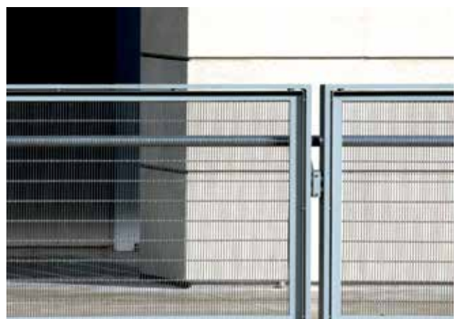
Titel + Bild 4: The Art Institute of Chicago, Illinois, , Architekt: Renzo Piano, Frankreich, Gewebe: Tigris PC